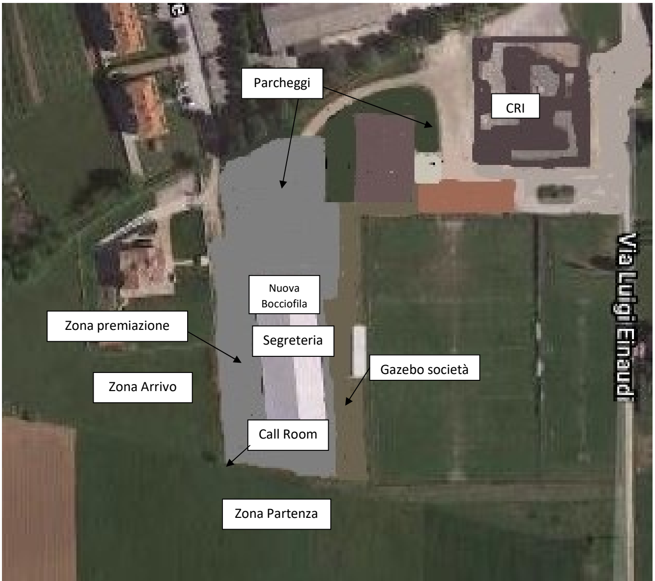
Giro 2 Km